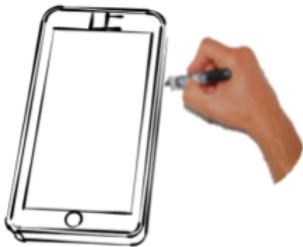
Croquis d'un smartphone en 3D