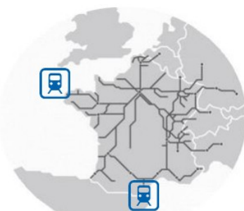
Besoin de se déplacer

A partir de nos besoins, nous définissons les produits et leurs fonctions d'usage . Cette fonction est l'usage rendu par un objet technique qui répond à un besoin . Elle est la même quel que soit son utilisateur , ses goûts et ses désirs . On trouve la fonction d'usage en posant la question « A quoi sert l'objet ? ».