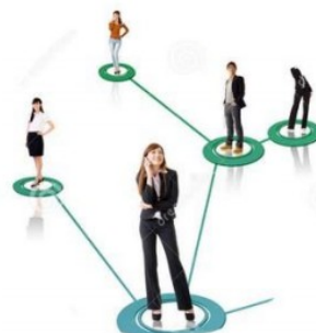
Besoin de communiquer

Le TGV permet à plusieurs personnes de se déplacer à travers la France grâce à un moteur électrique.