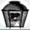
Réverbère à huile

Combustion de matière organique ou végétale