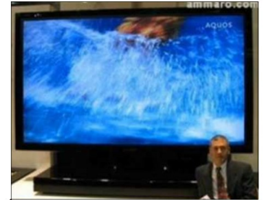
Téléviseur LDC de 2,50 m