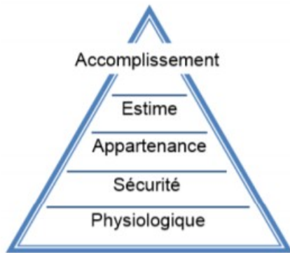
Pyramide des besoins

Le besoin est une nécessité ou un désir ressenti par une personne. Il évolue en fonction du progrès technique, des inventions et des innovations. Si l'objet technique ne répond pas à un besoin alors il n'est d'aucune utilité ! Un individu ressent différents besoins hiérarchisés.